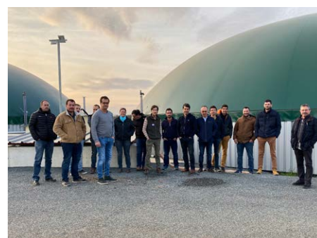
1 visite SAS Palmy Porc à Journiac (24)