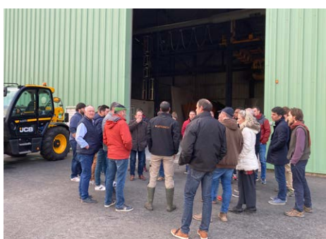
1 visite SAS Methinnov à Melle (79)