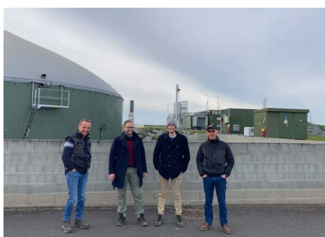
2 visite SAS PJF Bioenergies à Yversay (86)