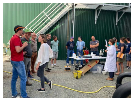
1 visite SAS Métharcenciel à Airvault (79)