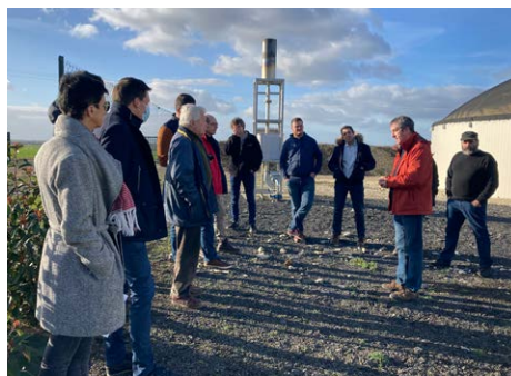
3 Visites SAS LMB Méthalioux à Jaunay Marigny (86)