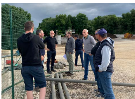
1 visite SAS Métha Bel Air à Linazay (86)