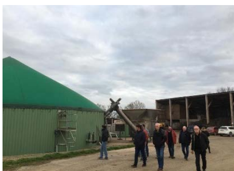
1 visite GAEC Vallée de la Vie à Maché (85)