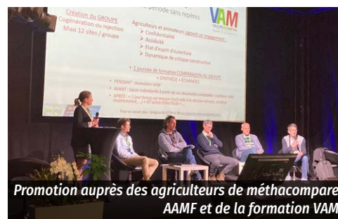
Promotion auprès des agriculteurs de méthacompare AAMF et de la formation VAM