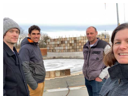
1 visite SAS Energie Fermière à Sanxay (86)