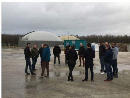
1 visite SAS AXIS à Bournaud (86)